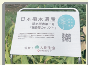
看板に企業名を記載